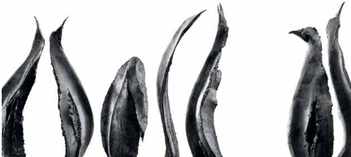
Empereur - Sculpture Patrick Roger

EXPOSITION DE SCULPTURES DE PATRICK ROGER , sculpteur, Exposition personnelle au château (exposition-vente)