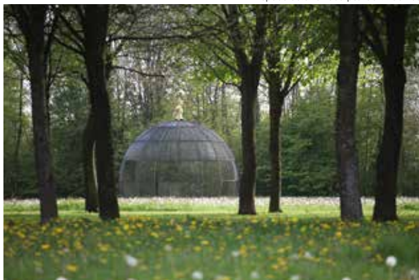
Gaïa · Sculpture J-M de Pas