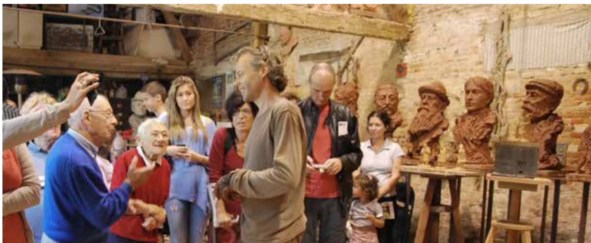
Visite Atelier J-M de Pas

LES JOURNÉES EUROPÉENNES DU PATRIMOINE – 10h à 18h Organisées par le Ministère de la Culture Thème « L'Art du partage »