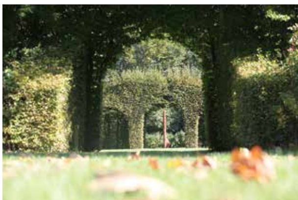
Cloître des Quatre Saisons · Sculpture J-M de Pas