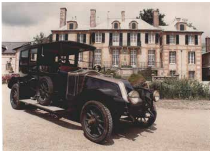
Voiture du Maréchal Joffre · Château de la Marquetterie de Taittinger

Ateliers modelage sans supplément 14h-18h Restauration traiteur sur place Inscription obligatoire pour les propriétaires de voitures et Clubs Chaque année, cet événement réunit une centaine d'exposants et accueille un millier de visiteurs.