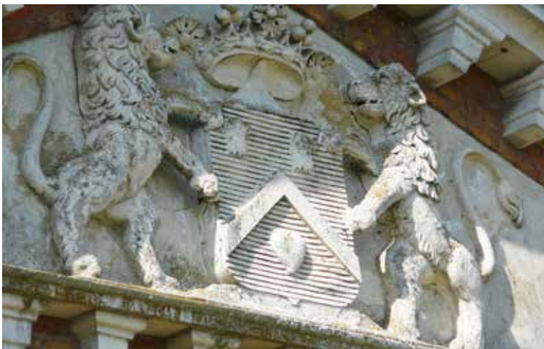
Armoiries Le Pesant - Fronton Château - Pierre Le Pesant de Bois-Guilbert - Sculpture J-M de Pas

Cet économiste a en particulier édité deux ouvrages, « Le Détail de la France » en 1695 où il analyse les causes de la misère en France et les moyens d'y remédier, et « le Factum de France » en 1707, où il pose les jalons d'une science économique. Il propose en particulier une réforme fiscale avec un seul impôt, 10% à la source pour tous. Il est aujourd'hui toujours considéré comme un économiste moderne.