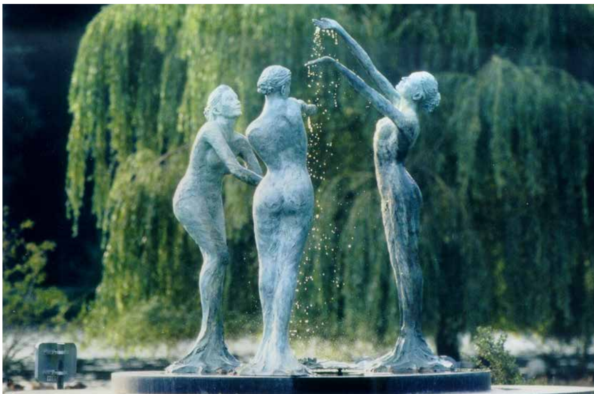
Fontaine les Trois Sources · Sculpture J-M de Pas · Forges-Les-Eaux

• JEAN-MARC DE PAS , créateur du jardin, œuvres permanentes et atelier sur place. Visite sur rendez-vous. www.jeanmarcdepas.com