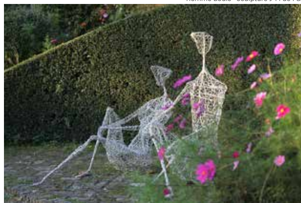
Couple en Grillage · Sculpture J-M de Pas