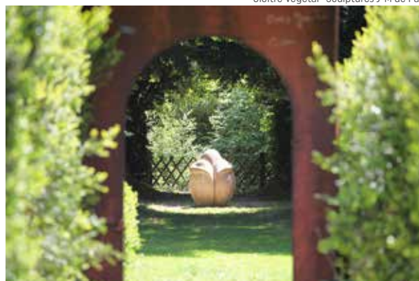
Homme Boule · Sculpture J-M de Pas