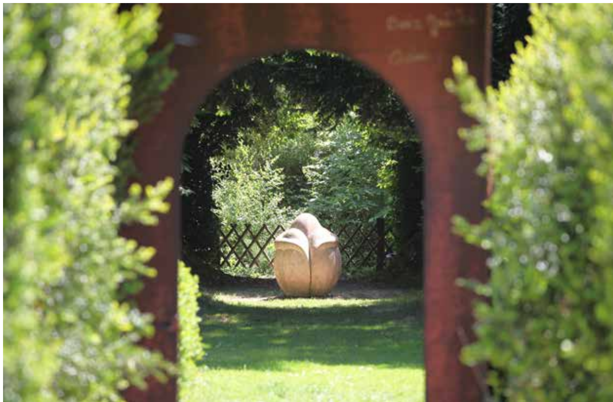
Homme Boule - Sculpture J-M de Pas - Jardin des Sculptures de Bois-Guilbert