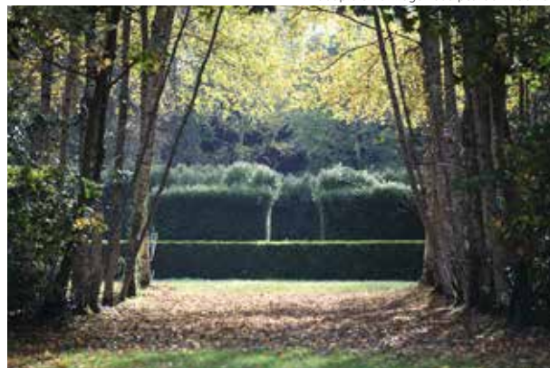
Labyrinthe & cercle de bouleaux · Jardin des Sculptures J-M de Pas