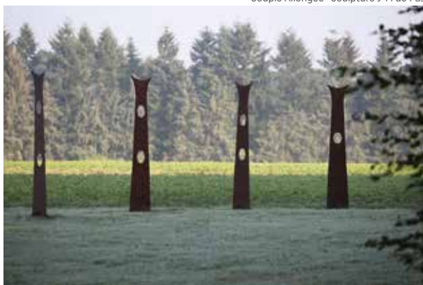
Espace Solaire · Sculpture J-M de Pas