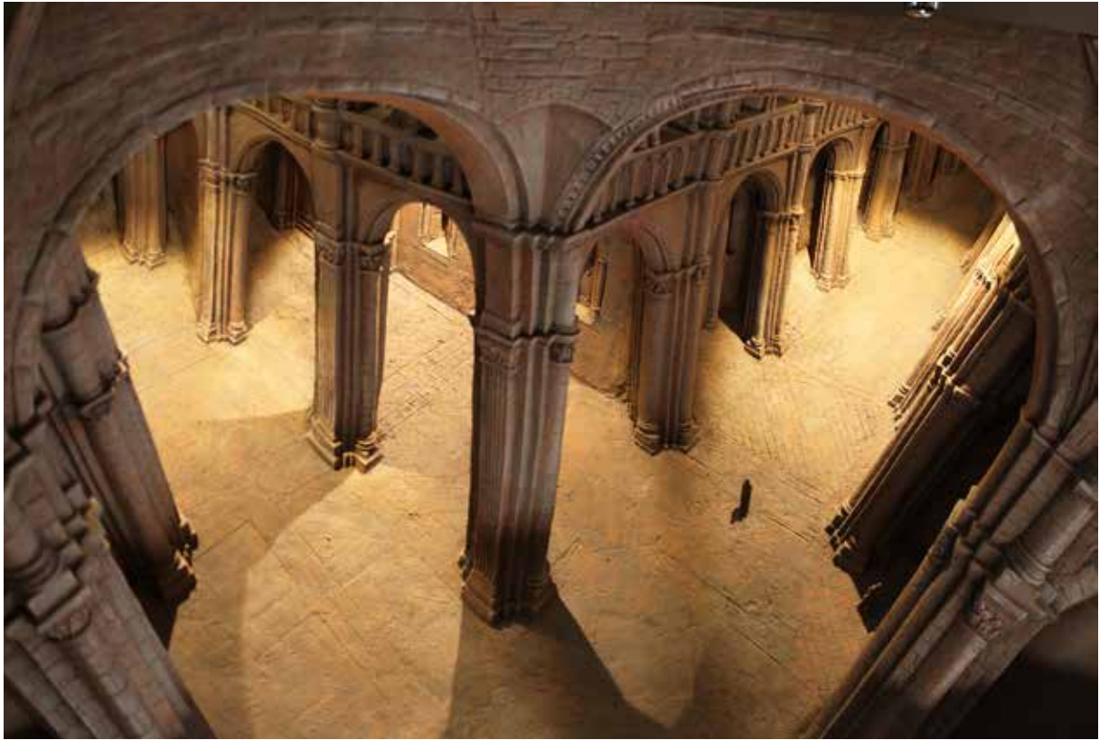
La nef · Sculpture Paul Day · Chapelle Jardin des Sculptures

Paul Day est l'auteur de plusieurs monuments, hauts-reliefs composant des frises narratives ou sculptures en rond de bosse expressives, et architectures en perspective remarquables.