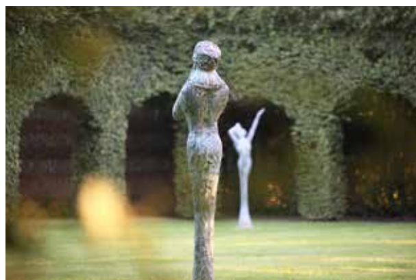
Cloître Végétal · Sculptures J-M de Pas