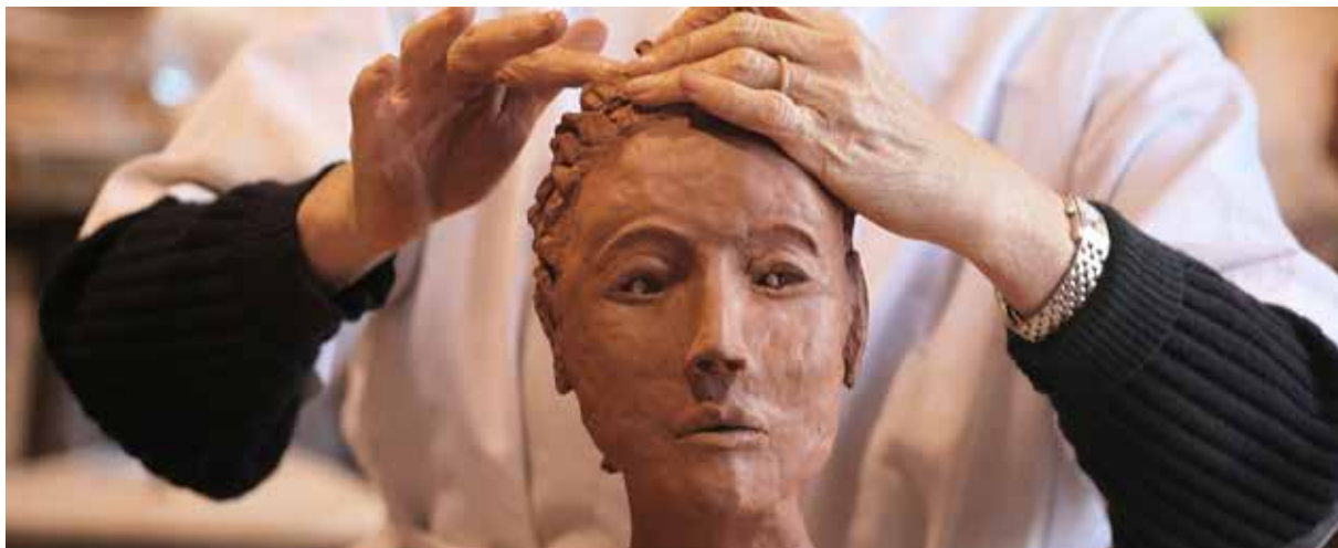
Atelier Modelage